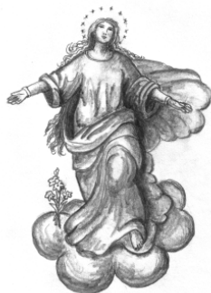
Mariä Himmelfahrt Furth im Wald