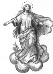
Mariä Himmelfahrt Furth im Wald