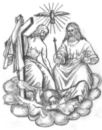
Hl. Dreifaltigkeit Ränkam